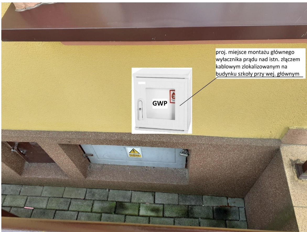
foto. projektowana lokalizacja dla głównego wyłącznika prądu GWP