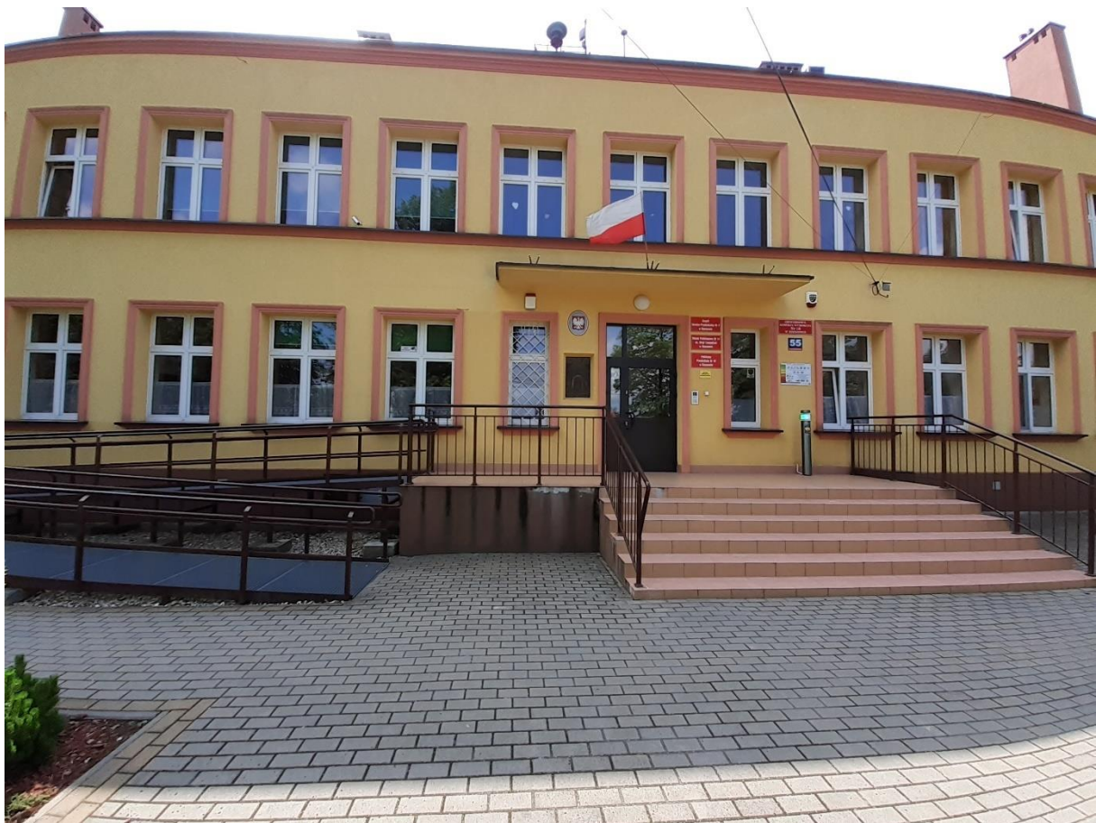
foto. Budynek Szkoły Podstawowej Nr 14, dla którego planuje się wymianę rozdzielnic elektrycznych oraz układu pomiarowego energii elektrycznej

Instalacja elektryczna wykonana w latach 50-tych przeszła modernizację w latach 80-tych i dostosowano ją do ówczesnych wymagań. Na dzień dzisiejszy instalacja elektryczna od strony zasilania jest przeciążona i wymaga remontu.