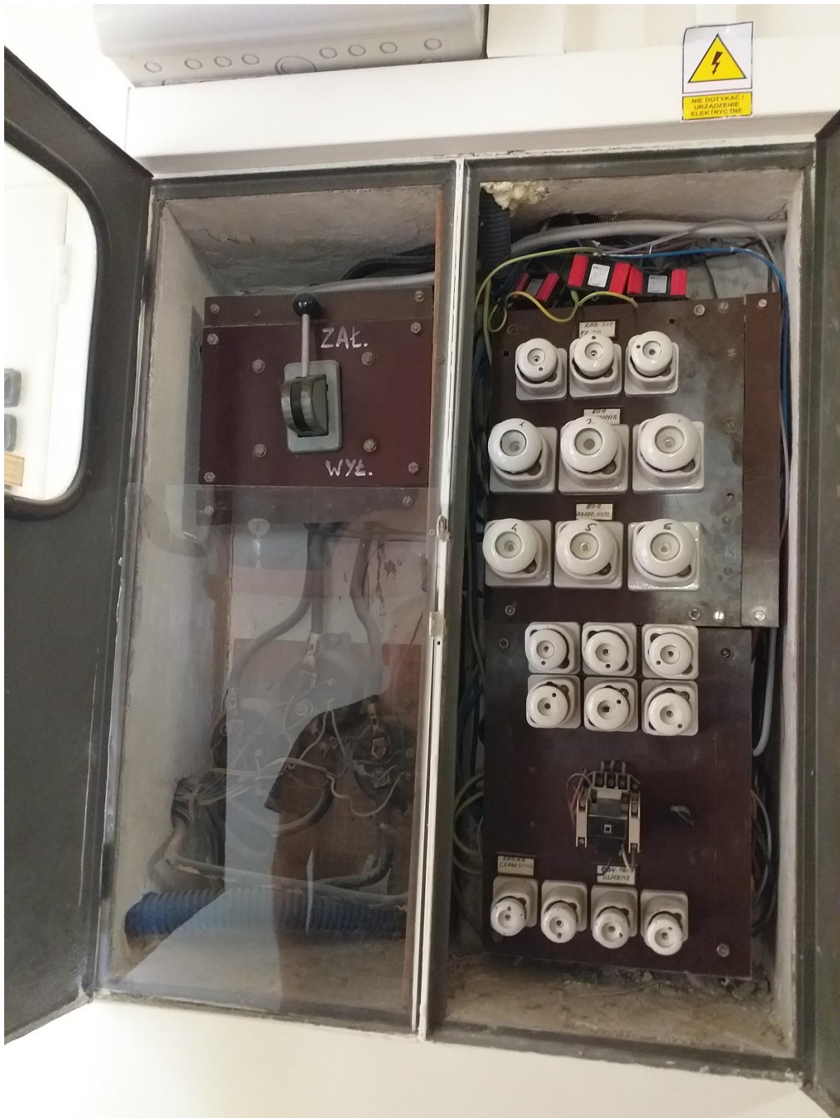
foto. istn. przekładniki pomiarowe energii, wyłącznik główny prądu oraz główna rozdzielnia zlokalizowane wewn. budynku na parterze