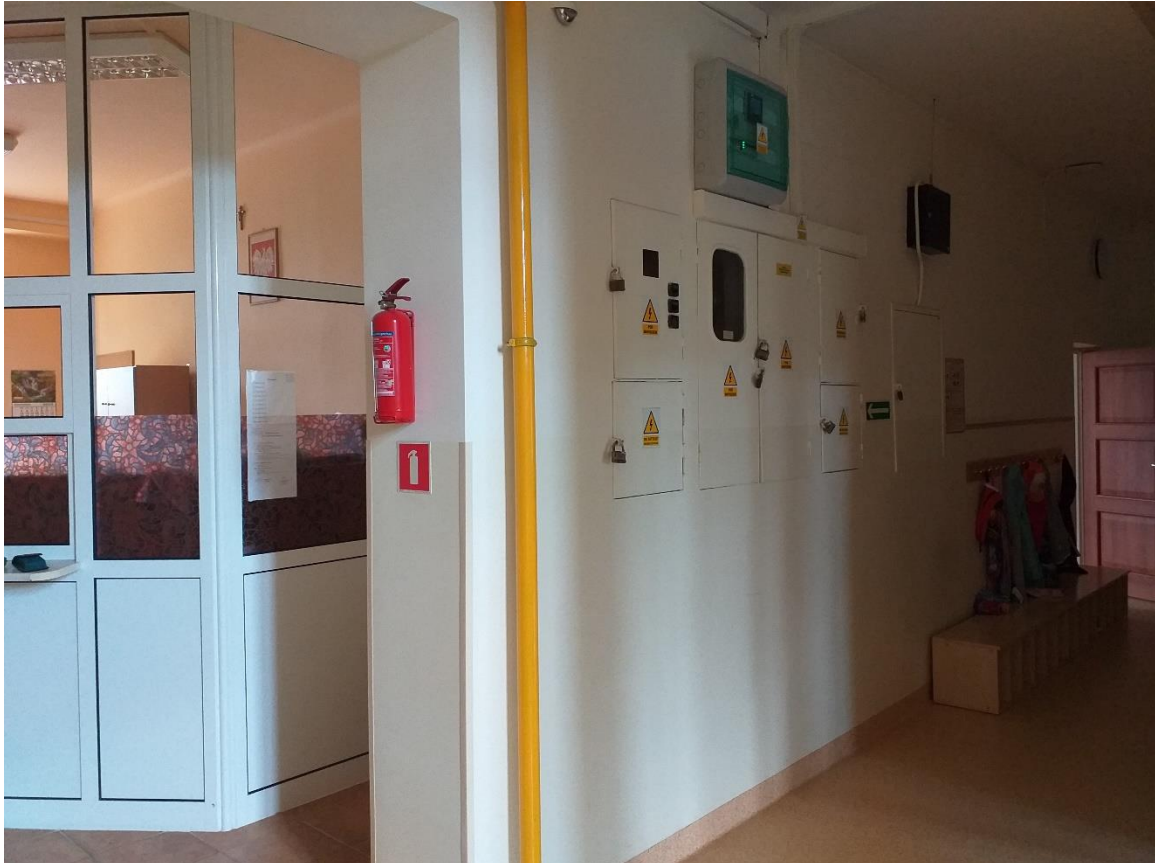
foto. istn. tablice pomiarowe oraz rozdzielni głównych budynku szkoły