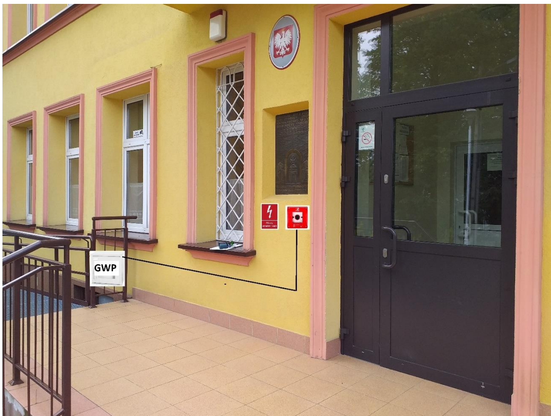
foto. projektowana lokalizacja dla głównego wyłącznika prądu GWP i przycisku P1