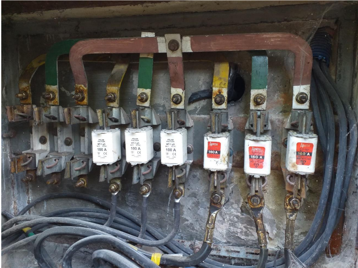
Foto. istn. złącze kablowe ZK-3 na zewn. w elewacji